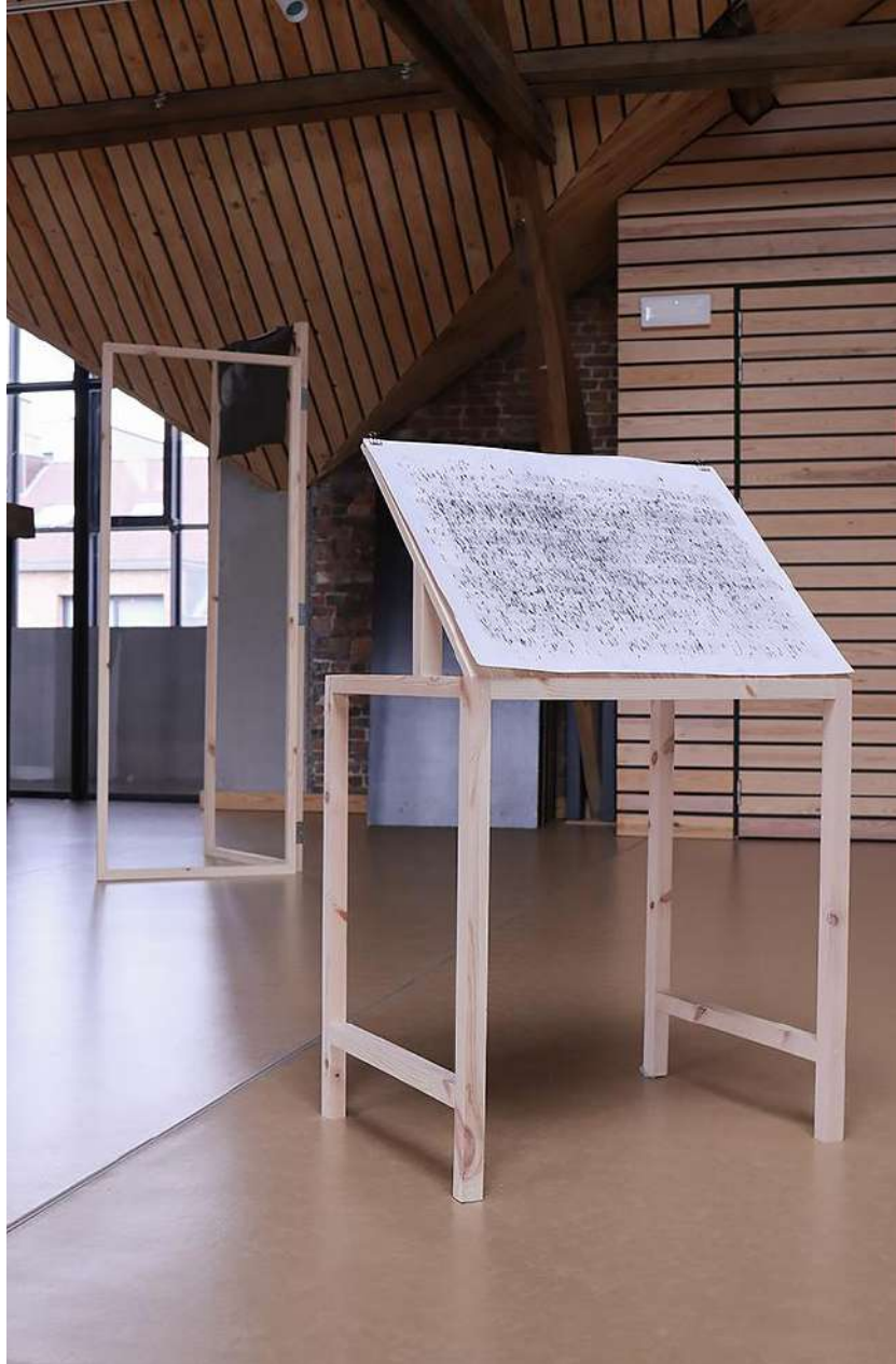
Drawing I, 2020. papier, graphite, structure (bois), 65 x 60 x 70 cm