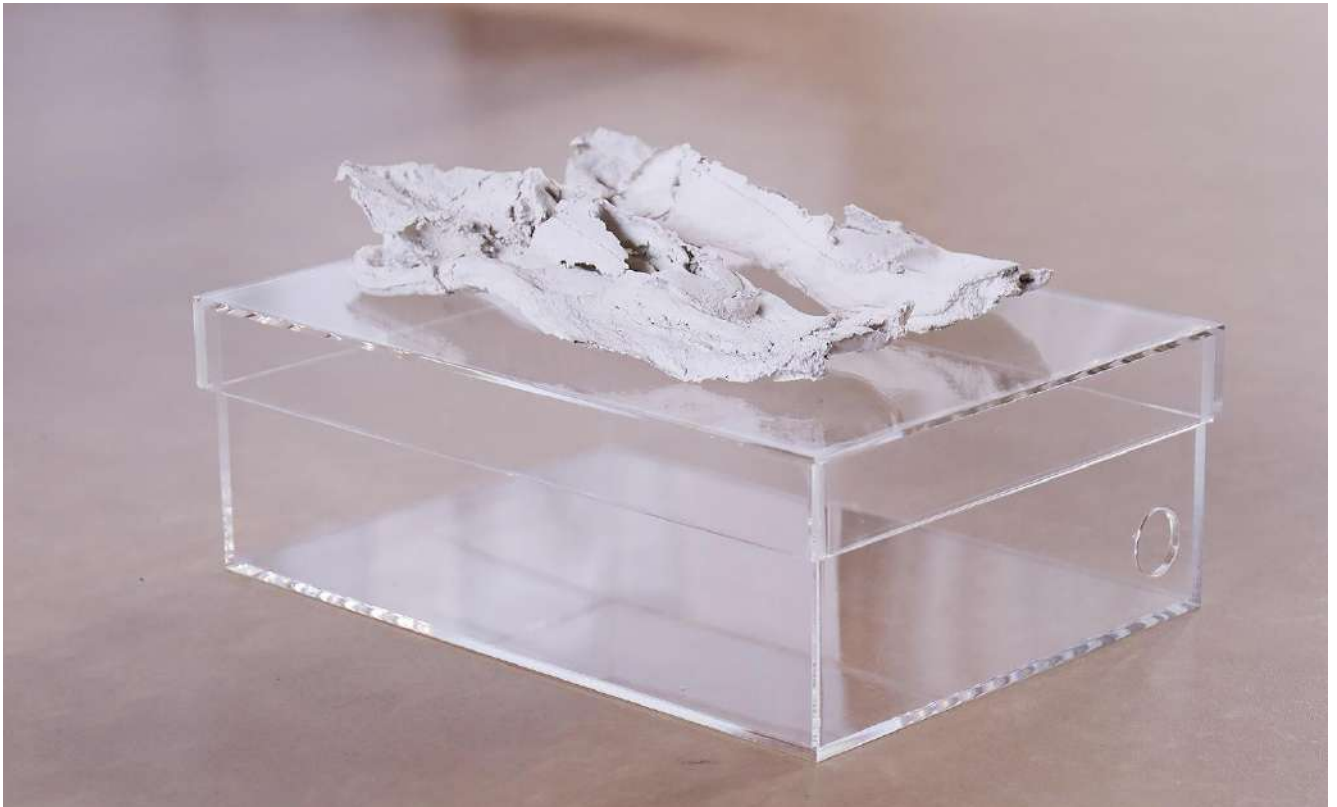
Sans titre (New Balance), 2020. Papier, résidus, plexiglass, 36 x 26 x 24 cm