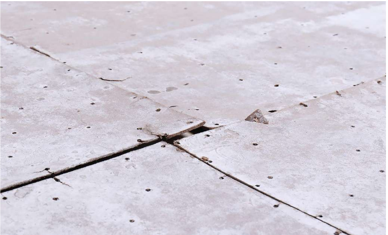
(détail) Sans titre (Studio View), 2020. Bois, peinture, résidus, 400 x 300 cm